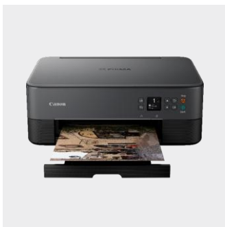
Řada PIXMA TS5350i