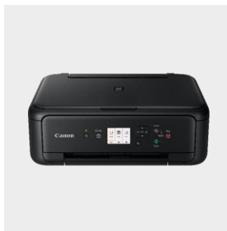
Řada PIXMA TS5150